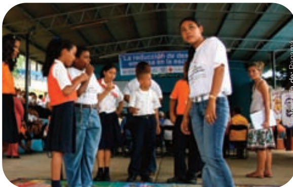
Día Internacional de RRD / Panamá