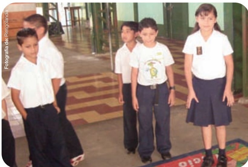
Niños jugando Riesgolandia / Costa Rica