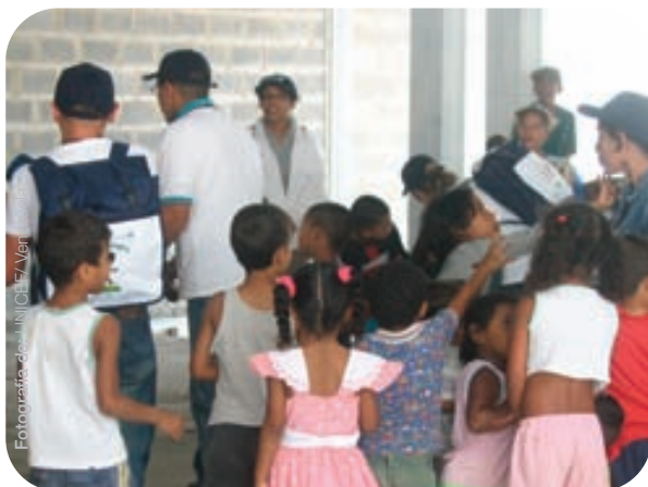
Participantes programa Retorno a la Alegría.

Esta colaboración ha fortalecido la capacidad del Ministerio de Educación así como ha involucrado a otros socios de organizaciones nacionales e internacionales en actividades de educación en emergencias.