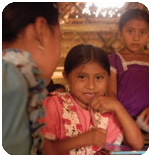
Toledo Distric / Belize