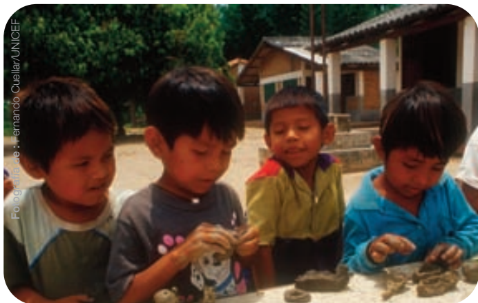
Participación de niños en actividades de un Centro de Enseñanza para Migrantes dedicado a los niños birmanos afectados por el tsunami, Parakang Cape, distrito de Takua Pa / Tailandia